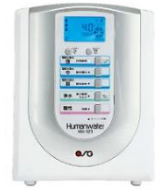
OSG 電解水素水浄水器 228,000円(税抜価格)