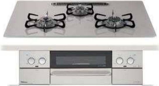
パロマ PD-810WV-75GJ " PD-810WV-60GJ 天板の大きさが75cmと60cmの2タイプあります

新商品キャンペーン 期間中、対象のコンロをお買い上げで もれなくグリルで使える波型プレート 『ラ・クック』プレゼント