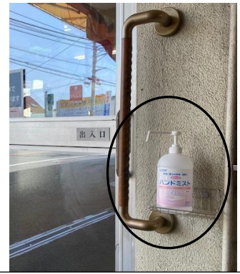
店舗の出入り口に次亜塩素酸水の設置をしています。ご自由にお使い下さい。

お客様におかれましては、ご不便をおかけいたしますが何卒ご理解と御協力をお願い申し上げます。