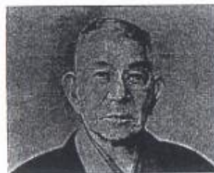
中村天風 (1876~1968) 日本初のヨーガ行者、天風会の創始者、心身統一法を広める。

人間が人間として生きていくのに、一番大切なのは、頭の良し悪しではなく、心の良し悪しだ。